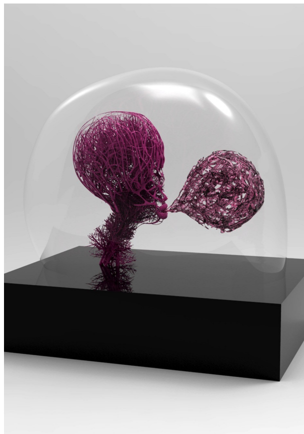
Sculpture Bubble gum , 3D printing, mixed media, 50 x 30 x 50 cm

In his work, the body is reinvented. It is no longer a sole amount of muscles, tissues and flesh. The artist manages to grasp something different, something more aerial and more ungraspable. An invisible fluid seems to flow throughout the body.