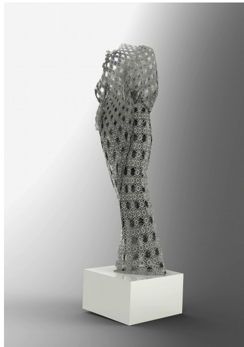
Sculpture Dress , 2013, 3D printing, mixed media, 30 x 30 x 125 cm. Limited edition of 6 copies.

For this exhibition, we decided to show several paintings which highlight the urban architecture poetry losing itself in the excess of forms and lines, and also many sculptures reminding us of the material's fineness.