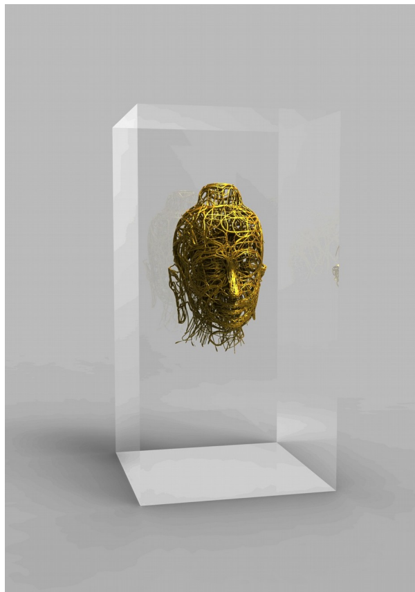
Sculpture Asian head , 3D printing, mixed media, 18 x 20 x 35 cm

Just as others who are deeply attached to their visual inspiration, Duong is mute and clumsy